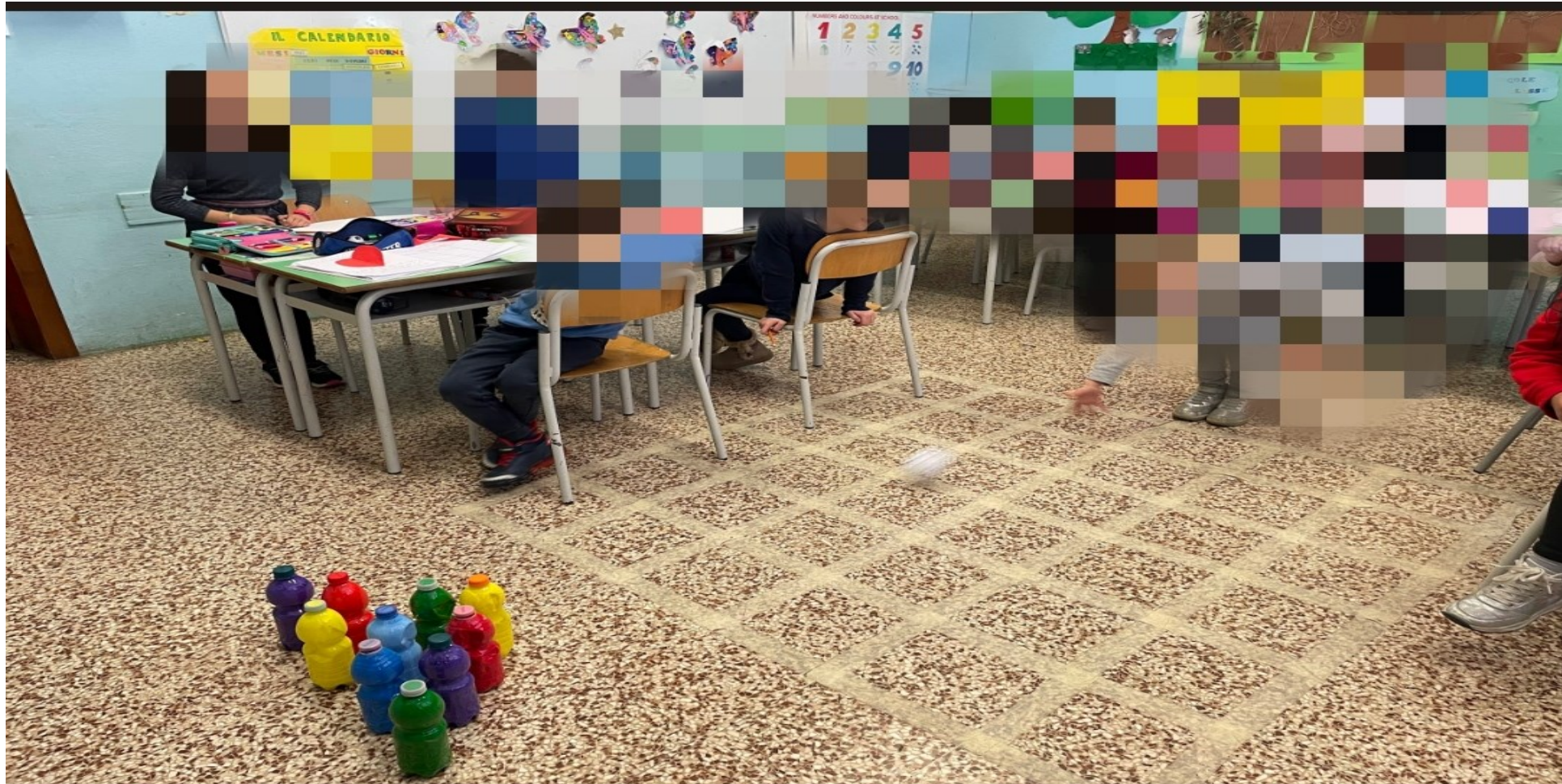
Foto dell'attività svolta