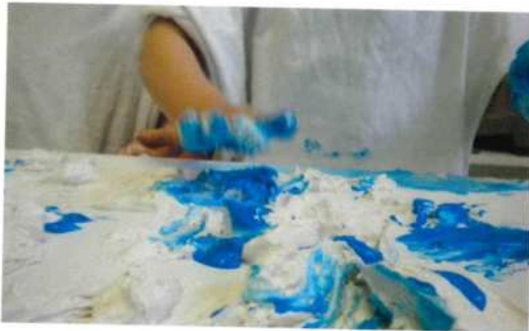
Colore che si schiaccia