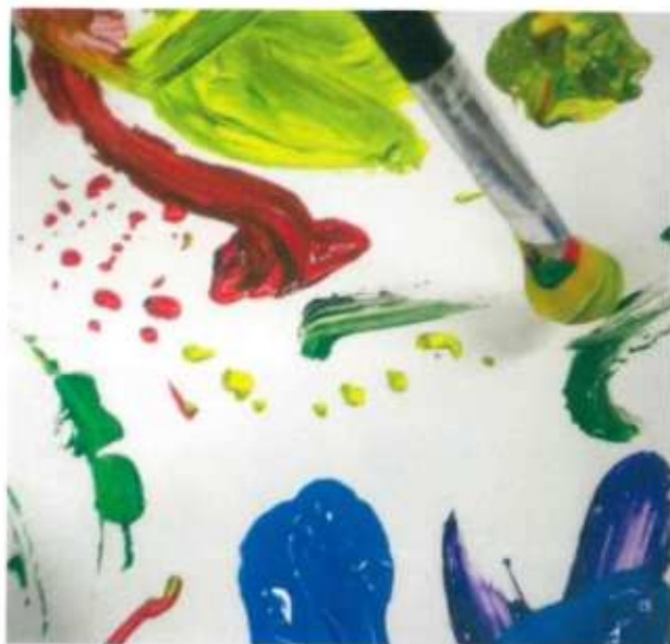
Colore che lascia tracce