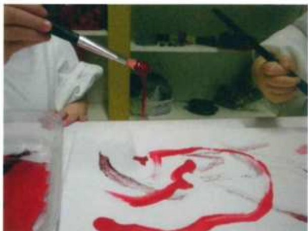
Rosso che ride