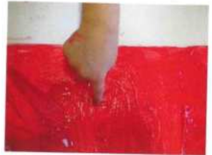
Colore che si tocca

Un processo scientifico, che unisce apprendimento e atto creativo.