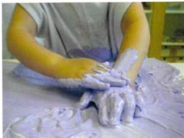
Colore che trasforma