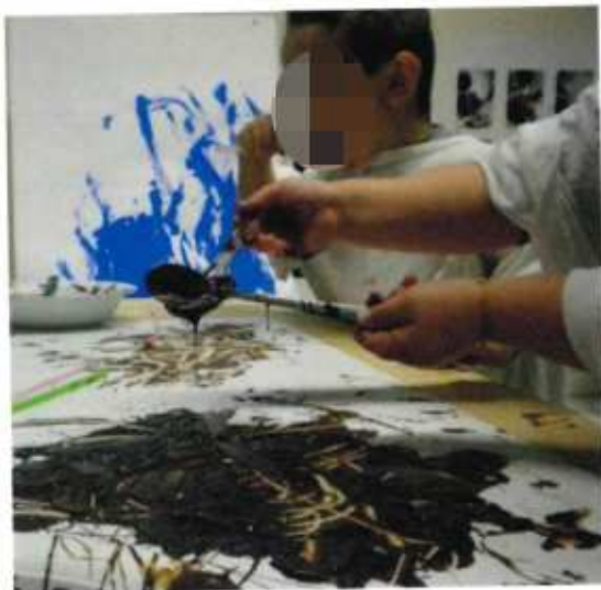
Colore che si assaggia