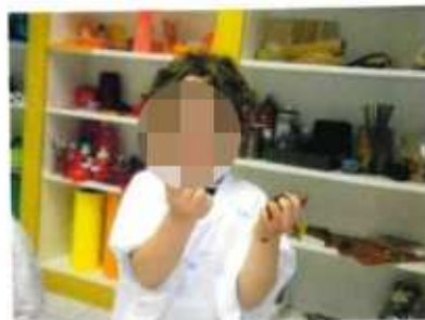
Colore che profuma