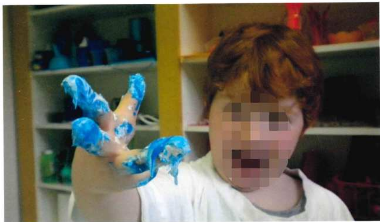
Colore che si appiccica