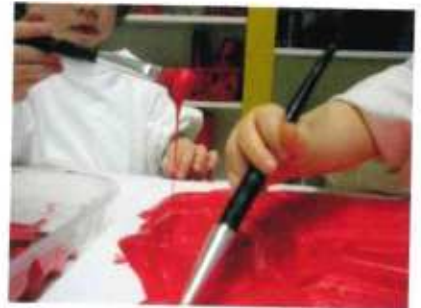
Colore che gocciola