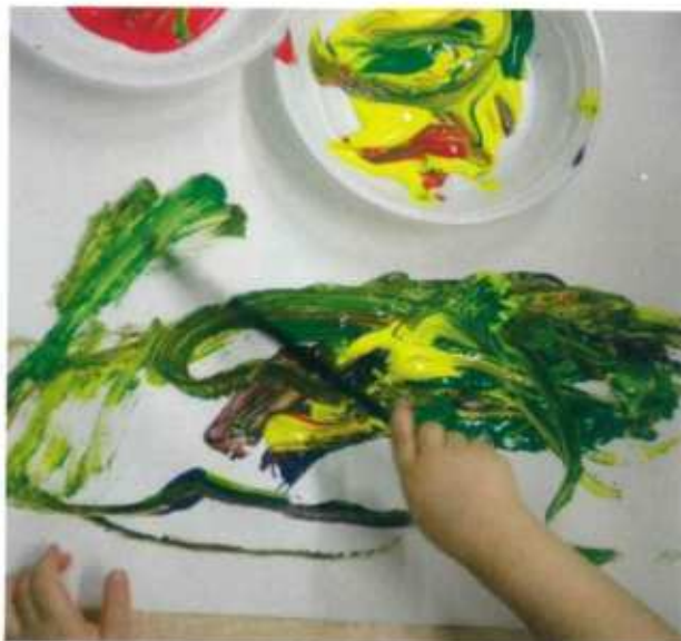
Colore che si mescola